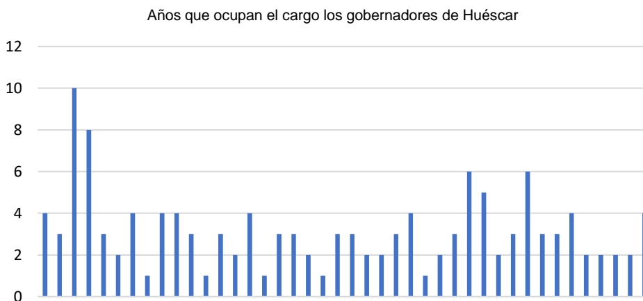
GRÁFICO 1. NÚMERO DE AÑOS QUE OCUPAN EL CARGO LOS GOBERNADORES DE HUÉSCAR (1513-1688) 62