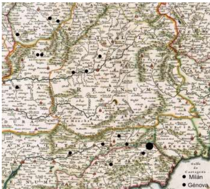
Mapa 1. Los orígenes geográficos de los gobernadores de Huéscar (1513-1688)